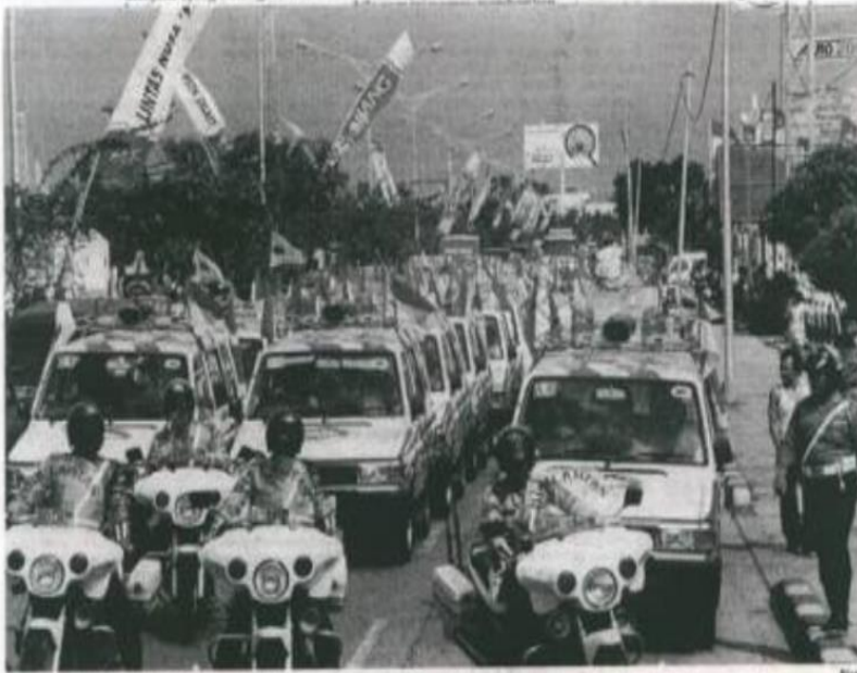
Iring-iringan 50 unit mobil Kijang dalam acara Lintas Nusa dari Banda Aceh sampai Larantuka, NTT

Nusa ini. Keberhasilan TAM melibatkan orang-orang penting dalam event ini jelas menunjukkan adanya perencanaan yang sangat matang dalam menyelenggarakan Lintas Nusa. Suatu event yang dilakukan oleh suatu per-