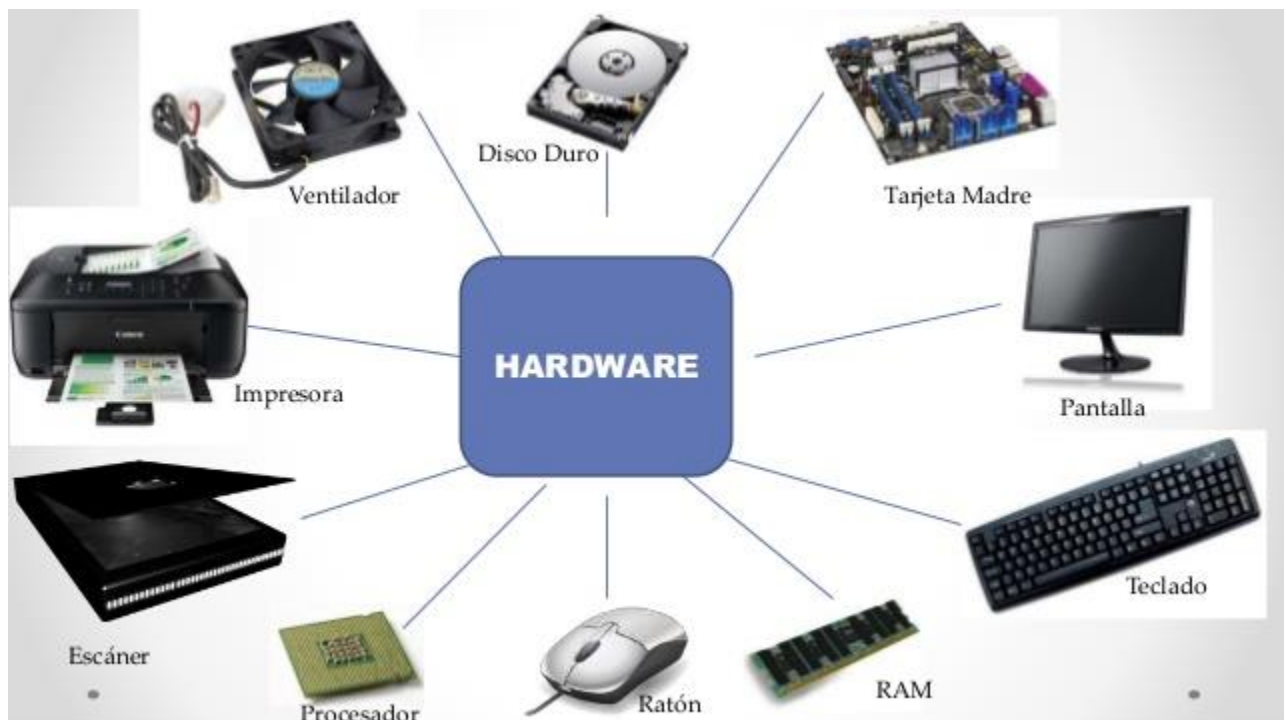
Gambar 4 Perangkat keras komputer

Pengertian dari hardware atau dalam bahasa Indonesia-nya disebut juga dengan nama “perangkat keras” adalah salah satu komponen dari sebuah komputer yang sifat alat nya bisa dilihat dan diraba secara langsung atau yang berbentuk nyata, yang berfungsi untuk mendukung proses komputerisasi. Hardware dapat bekerja berdasarkan perintah yang telah ditentukan ada padanya, atau yang juga disebut dengan dengan istilah instruction set. Dengan adanya perintah yang dapat dimengerti oleh hardware tersebut, maka hardware tersebut dapat melakukan berbagai kegiatan yang telah ditentukan oleh pemberi perintah. Secara fisik, Komputer terdiri dari beberapa komponen yang merupakan suatu sistem. Sistem adalah komponen-komponen yang saling bekerja sama membentuk suatu kesatuan. Apabila salah satu komponen tidak berfungsi, akan mengakibatkan tidak berfungsinya proses-proses yang ada komputer dengan baik. Komponen komputer ini termasuk dalam kategori elemen perangkat keras (hardware). Berdasarkan fungsinya, perangkat keras komputer dibagi menjadi :