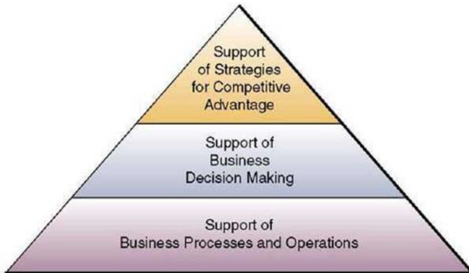
Gambar 1. Peran Teknologi Informasi dalam sebuah perusahaan

suatu perusahaan senantiasa berkompetisi dengan kompetitornya dalam upaya memberikan layanan produk dan pelayanan yang lebih baik kepada para pelanggannya yang sangat bervariasi di berbagai lokasi yang berbeda. Badan usaha ini akan dapat menggunakan sistem informasi untuk menunjang efisiensi operasi usahanya dan efektifitas pengelolaan usahanya.