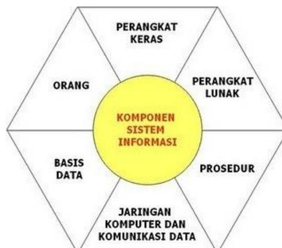
Gambar 2 Elemen sistem informasi