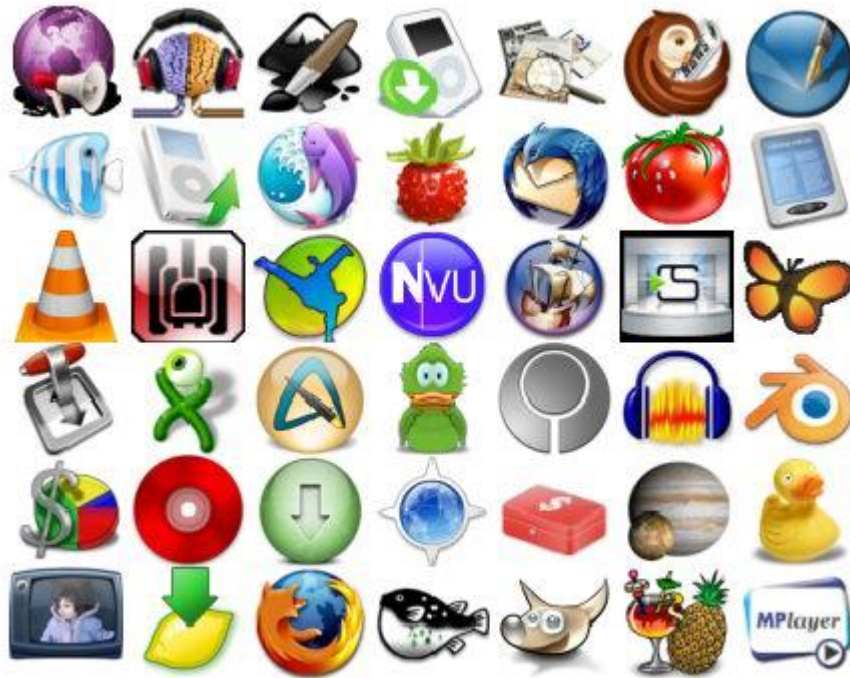
Gambar 6 Software freeware

untuk disumbangkan kepada komunitas. Perangkat lunak gratis yang dibuat oleh pengembang tetap memiliki hak cipta agar dapat mengontrol terhadap pengembang selanjutnya.