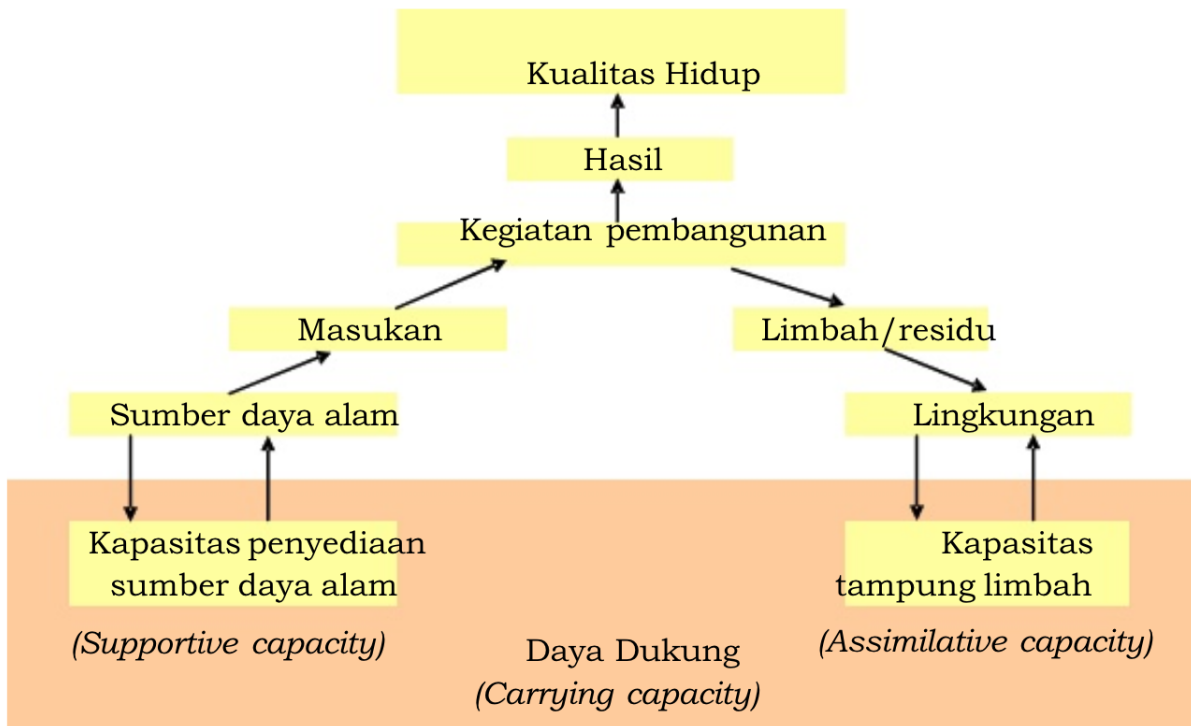
Gambar 1. Daya Dukung Lingkungan Sebagai Dasar Pembangunan Berkelanjutan

Dalam pedoman ini, telaahan daya dukung lingkungan hidup terbatas pada kapasitas penyediaan sumber daya alam, terutama berkaitan dengan kemampuan lahan serta ketersediaan dan kebutuhan akan lahan dan air dalam suatu ruang/wilayah. Oleh karena kapasitas sumber daya alam tergantung pada kemampuan, ketersediaan, dan kebutuhan akan lahan dan air, penentuan daya dukung lingkungan hidup dalam pedoman ini dilakukan berdasarkan 3 (tiga) pendekatan, yaitu: