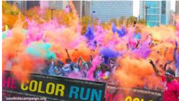
Kegiatan Lomba Lari "Color Run"

Jenis kegiatan harus dipikirkan dengan matang. Keputusan mengenai kegiatan atau acara yang akan diselenggarakan bahkan dapat lebih dahulu diambil dibandingkan pembentukan panitia.