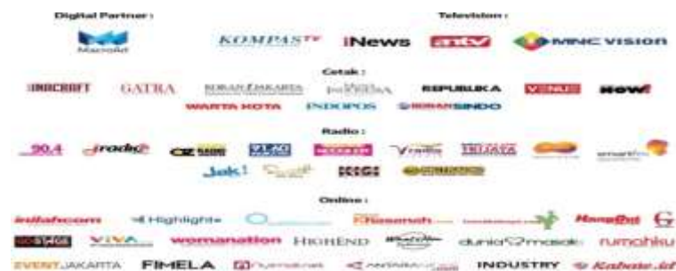
Media Partner Inacraft 2018