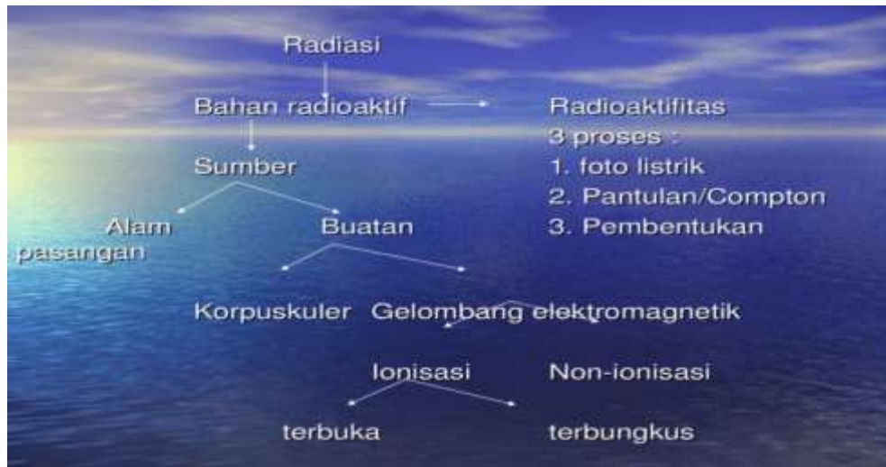
Gambar 2. Bagan jenis-jenis radiasi

Perkembangan ilmu kedokteran saat ini, termasuk radiologi dan kedokteran nuklir sangat pesat, didukung oleh perkembangan teknologi instrumentasi untuk pembuatan citra alat tubuh dengan komputer sebagai pengolah data. Kini telah berkembang menjadi peralatan canggih kamera gamma dan kamera positron yang dapat menampilkan citra alat tubuh dua dimensi ataupun tiga dimensi baik bersifat statis maupun dinamis. Dalam kedokteran nuklir, menggunakan sumber radiasi terbuka buatan yang berasal dari disintegrasi inti radionuklida, baik yang dimasukkan ke dalam tubuh pasien (studi invivo ) maupun hanya direaksikan saja dalam bahan biologis yang diambil dari tubuh pasien (studi in-vitro ).