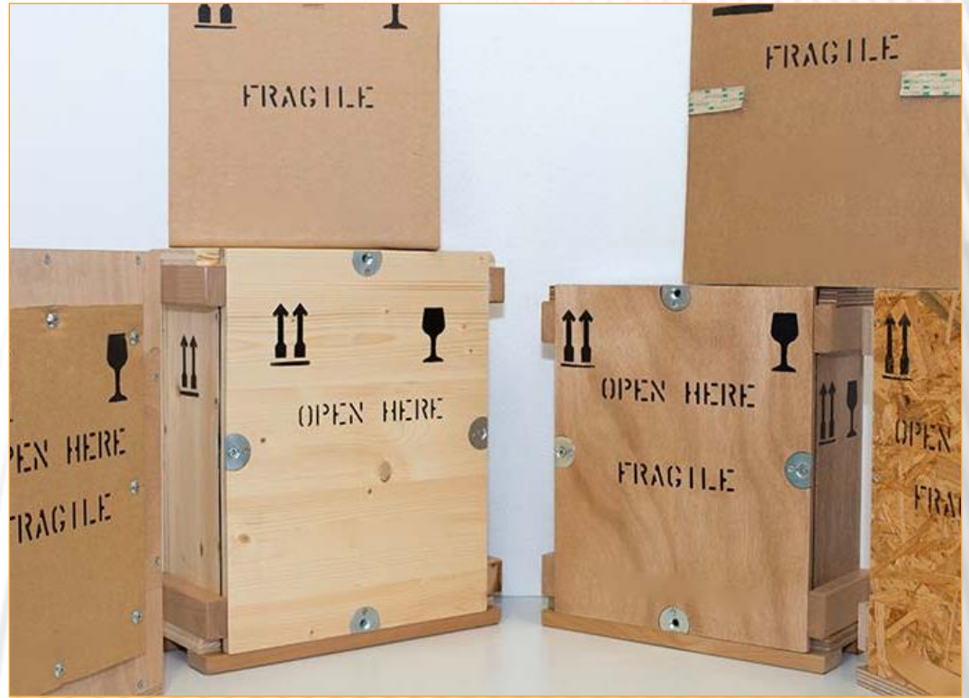
Contoh Bentuk Aplikasi Packaging