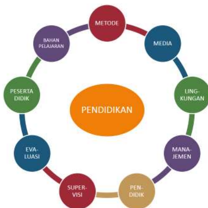
Gb.1. Pendidikan sebagai Sistem

Pendidikan juga merupakan suatu sistem sosial. Sistem sosial merupakan sebuah kesatuan peristiwa atau kejadian yang dilakukan oleh sekelompok orang untuk mencapai suatu hasil yang ditetapkan. Pendidikan merupakan suatu sistem terbuka yaitu sistem yang memperoleh masukan dari lingkungan dan memberikan hasil transformasinya kepada lingkungan. Sebagai suatu sistem, maka pendidikan memiliki komponen atau yang disebut pula sebagai sub sistem. Sub sistem pendidikan itu dapat digambarkan sebagai berikut: