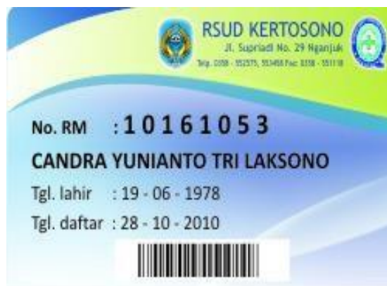
Gambar 3.5 Kartu berobat

Beberapa contoh kartu berobat dari beberapa rumah sakit dapat dilihat sbb: