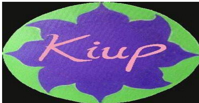
Gambar 3.1 KIUP

Indeks merupakan suatu petunjuk yang memberikan referensi kepada pengguna yang dapat digunakan untuk mengolah data. Indeks dapat dibuat dalam format manual (kertas) atau elektronik. Bentuk indeks yang digunakan dalam manajemen informasi kesehatan (MIK) ada beberapa jenis. Mari, kita pelajari lebih lanjut mengenai indeks pasien atau yang sering dikenal dengan istilah indeks utama pasien/ IUP.