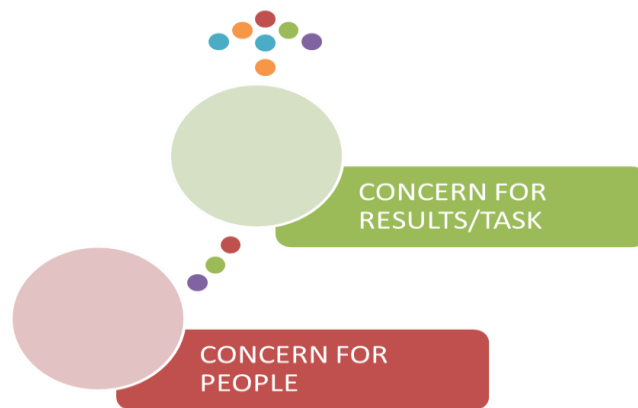
Gambar 6. Pendekatan Gaya Kepemimpinan Peduli ( Caring Leadership )

Seorang pemimpin dalam menjalankan tugasnya dapat berfokus pada kedua hal, yaitu: