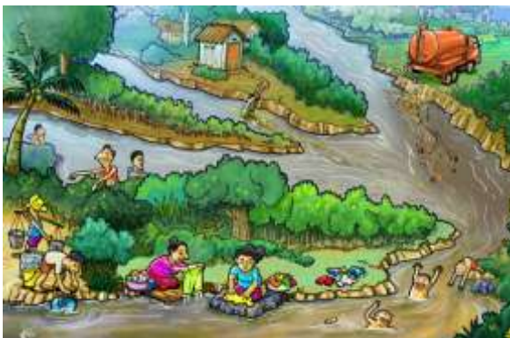
Gambar VII: http://www.ebiologi.net http://jikalahari.or.id