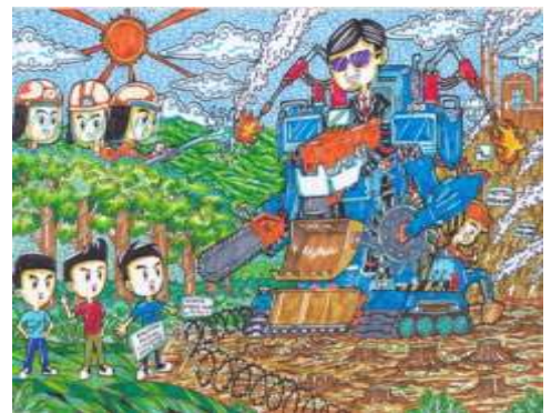
Gambar diambil dari

Pada dasarnya masyarakat sudah mengetahui isu-isu ketuhanan dan kemanusiaan yang ada di balik pembangunan pusat tenaga nuklir tersebut. Isu ketuhanan dikaitkan dengan dikesampingkannya martabat manusia sebagai hamba Tuhan Yang Maha Esa, dalam pembangunan iptek. Artinya, pembangunan fasilitas teknologi sering kali tidak melibatkan peran serta masyarakat sekitar, padahal apabila terjadi dampak negatif berupa kerusakan fasilitas teknologi, maka masyarakat yang akan terkena langsung akibatnya. Masyarakat sudah menyadari perannya sebagai makhluk hidup yang dikaruniai