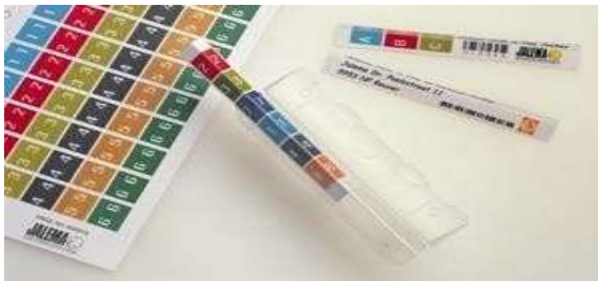
Gambar 5.22 Stiker Penomoran Rekam Medis