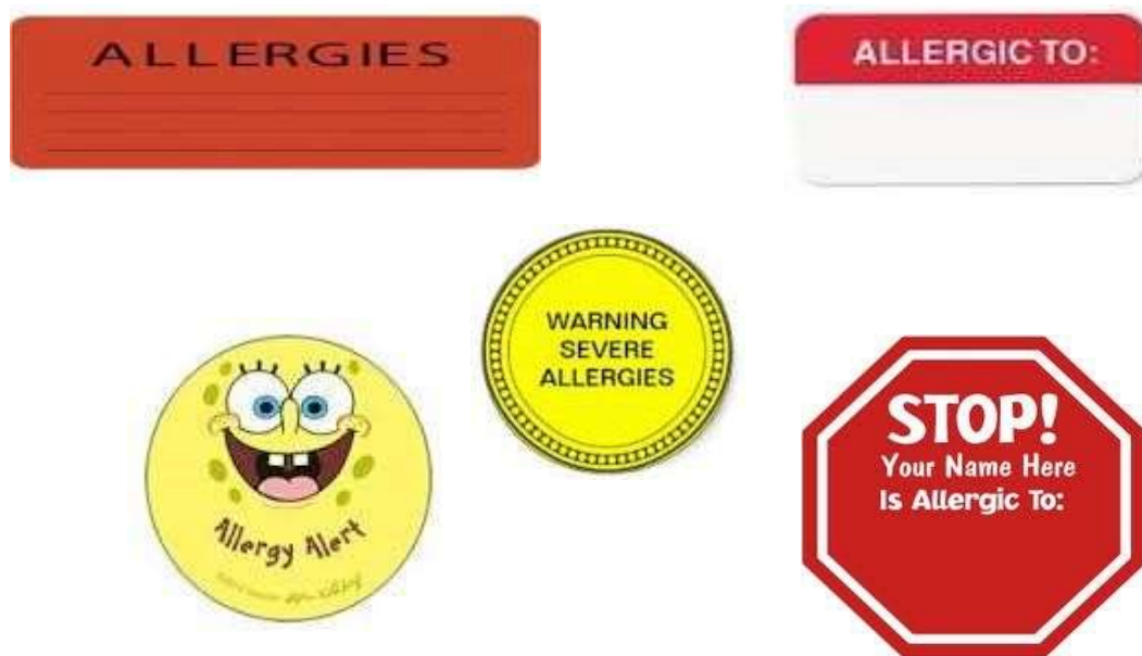
Gambar 5.20 Simbol-simbol alergi yang digunakan di rekam medis

sheet) di bawah JUDUL KHUSUS. Bila informasi terkait adalah sesuatu yang dapat ditemukan di dalam berkas rekam medis, maka gunakan COLOUR STRIP untuk menunjukkan bahwa ada informasi penting dan khusus yang tercatat di situ.