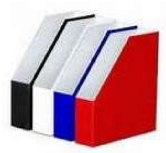
Gambar 5.11 contoh Rak Sortir rekam medis