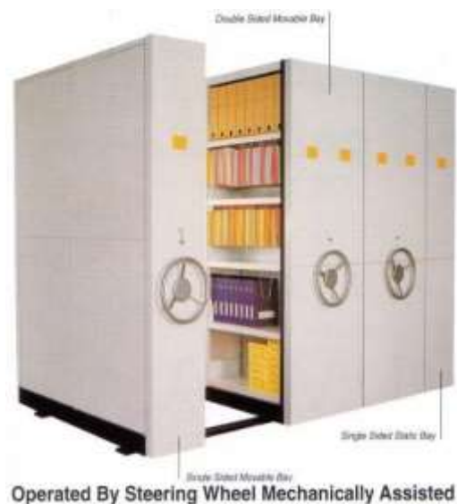
Gambar 5.5 Mechanically Roll o pack

Adalah rak penyimpanan modern untuk menyimpan rekam medis, dibuka dengan cara mekanik/ diputar sesuai sub rak rekam medis pasien.