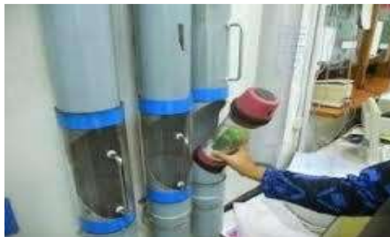
Gambar 5.19 kegiatan distribusi rekam medis menggunakan Pneumo tube