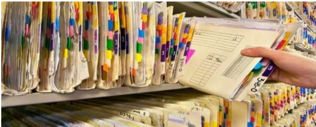
Gambar 5.20 Menggambil Rekam Medis vol 2

Satu Rekam Medis kadang kala terdiri dari sangat banyak lembar kertas sehingga begitu tebal, adakalanya satu Rekam Medis yang karena terlalu tebal; perlu dipisahkan menjadi beberapa volume. Tanda indikasi Volume 1, Volume 2 dst. dari satu Rekam Medis harus jelas di bagian sampul dan mudah terbaca, juga harus ditulis di atas lembar slip keluar. Harus diingat bahwa semua sampul hendaknya diberi tanda, ump: Volume 1 dari 3, volume 2 dari 3 (bila terbagi dalam 3 volume). Perlu kebijakan yang mengatur apakah semua volume harus diambil atau volume yang terakhir saja, bila Rekam Medis itu diperlukan dikeluarkan dari rak