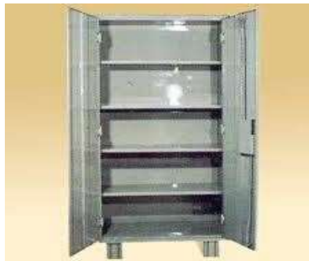
Gambar 5.15 Trolley rekam medis