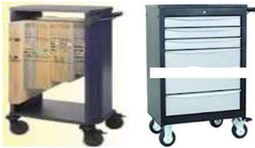
Gambar 5.14 Trolley rekam medis

b. Trolley (bila dalam jumlah banyak) alat untuk mendistribusi RM