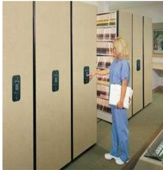
Gambar 5.4 Electrically Roll o pack

Adalah rak penyimpanan elektrik yang menggunakan kode untuk membuka rak sesuai dengan nomor rekam medis yang akan dicari.