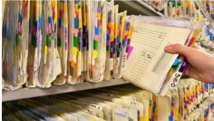
Gambar 5.2 Pengambilan Rekam Medis dari Rak Penyimpanan

Para mahasiswa, RM berisi riwayat penyakit pasien dan masalah kesehatan lain yang terkait dari pasien. Bila pasien datang kembali untuk mendapat pelayanan, pemberi pelayanan (dokter, perawat dan lainnya) memerlukan nya untuk kesinambungan pelayanan dan mengetahui tentang riwayat kesehatan masa lalu dari pasien tersebut. Rekam Medis pasien yang telah dijajar akan diambil kembali. Siapa sajakah yang membutuhkan RM dan untuk keperluan apa sehingga RM di ambil dari rak penjajaran? RM dibutuhkan oleh: