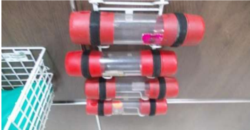
Gambar 5.18 Pneumo tube