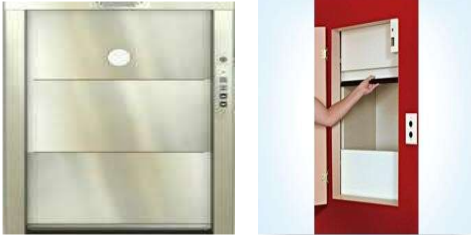
Gambar 5.16 Dumb Waiter elevators rekam medis