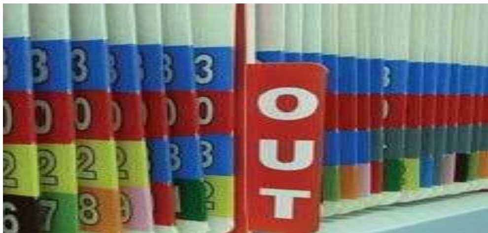
Gambar 5.9 Outguide/ Tracer dengan tanda "OUT" pada rak penyimpanan