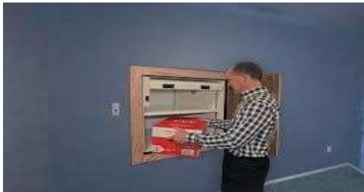
Gambar 5.17 Kegiatan memasukkan rekam medis ke dalam Dumb Waiter elevators