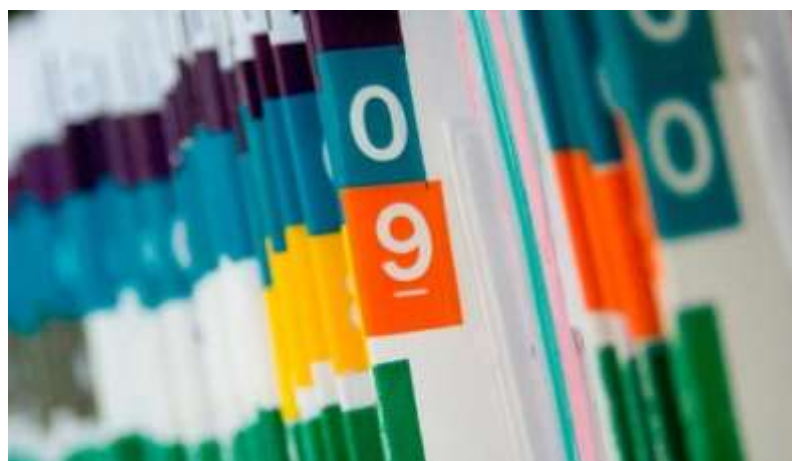
Gambar 5.24 Contoh menempel kode warna pada Rekam Medis