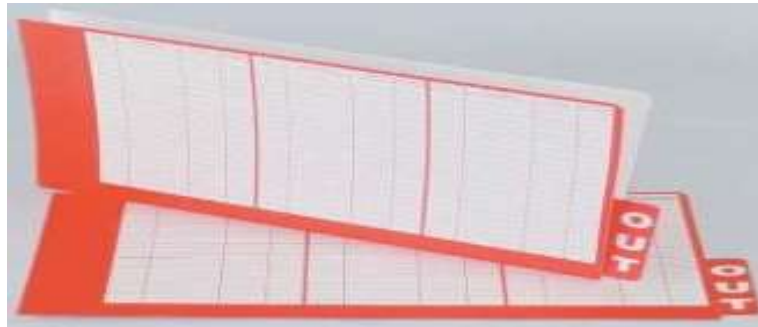
Gambar 5.8 Tracer dengan tanda "OUT"