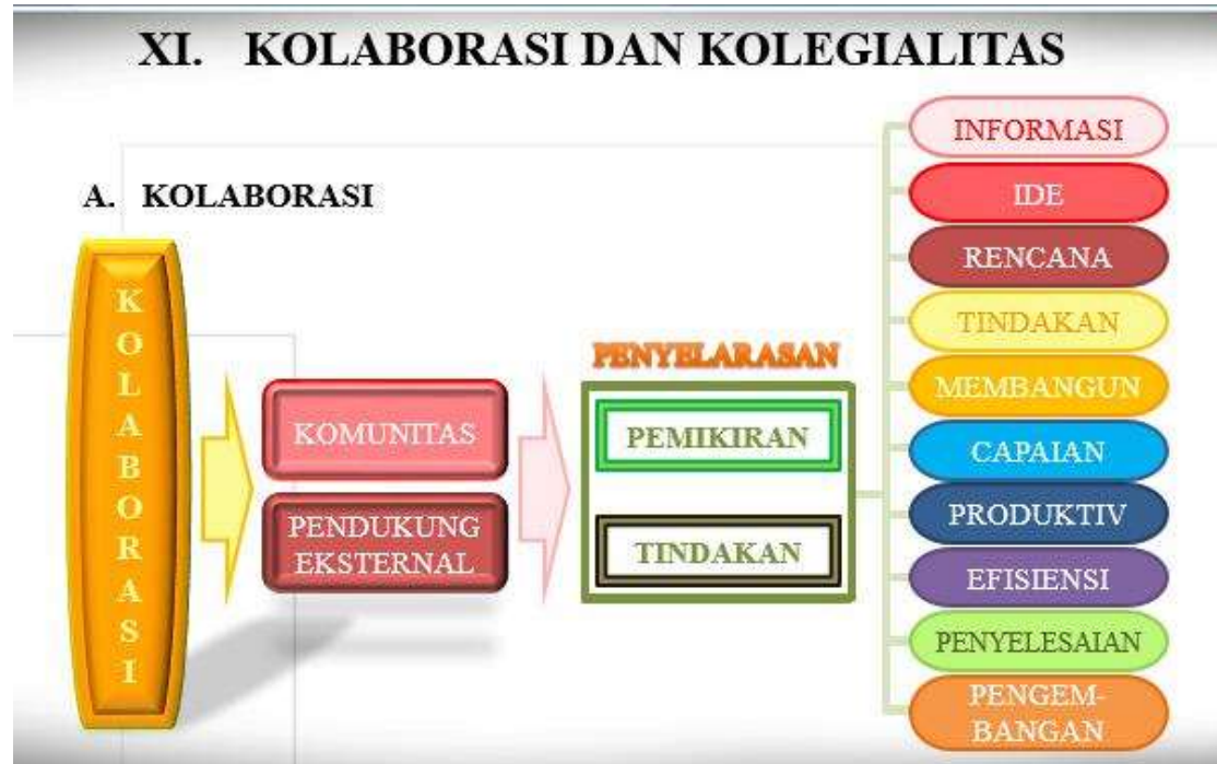
Gambar 12. Kolaborasi dan Kolegialitas