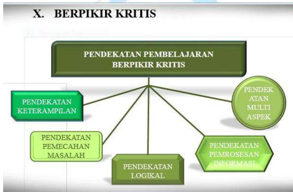
Gambar 11. Berpikir Kritis

Berpikir kritis adalah suatu proses berpikir secara intelektual dimana pemikir dengan sengaja menilai kualitas pemikirannya, pemikir menggunakan pikiran yang jernih dan rasional. (Istianah, 2013) Berpikir kritis sebagai berpikir yang digunakan secara sistematis dengan menggunakan bukti dan logika pada proses berpikirnya.