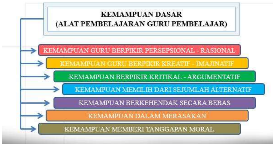
Gambar 9 Kemampuan Dasar