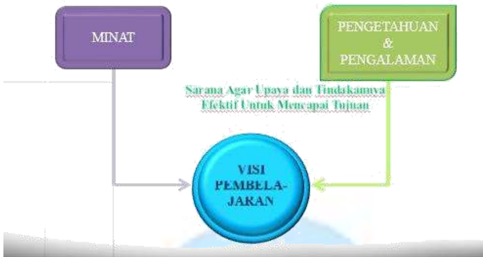
Gambar 3. Visi Pembelajaran

Visi adalah pandangan atau wawasan kedepan (KBBI). Visi juga dapat di artikan sebagai tujuan perusahaan atau lembaga dan apa yang harus dilakukan untuk mencapai tujuannya tersebut pada masa yang akan datang atau masa depan. Dalam Undang-undang Sistem Pendidikan Nasional Nomor 20 Tahun 2003, pasal 1 ayat 20 bahwa Pembelajaran adalah proses interaksi peserta didik dengan pendidik dan sumber belajar pada suatu lingkungan belajar. Untuk mewujudkan visi pembelajaran sekolah harus memberikan sarana agar upaya dan tindakan efektif untuk mencapai visi sekolah tersebut. Minat belajar siswa, pengetahuan dan pengalaman siswa yang baik akan dapat mewujudkan visi pembelajaran disuatu sekolah.