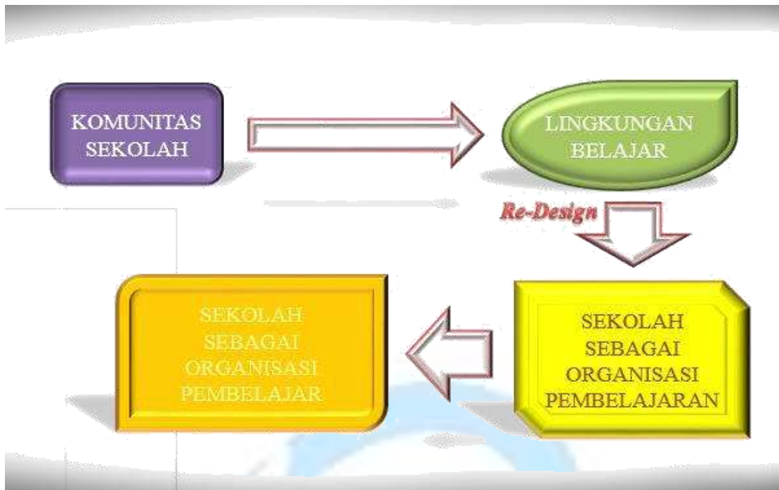
Gambar 8. Komunitas Sekolah

Komunitas sekolah terdiri dari: lingkungan belajar, sekolahs ebagai organisasi pembelajar dan sekolah sebagai organisasi pembelajar.