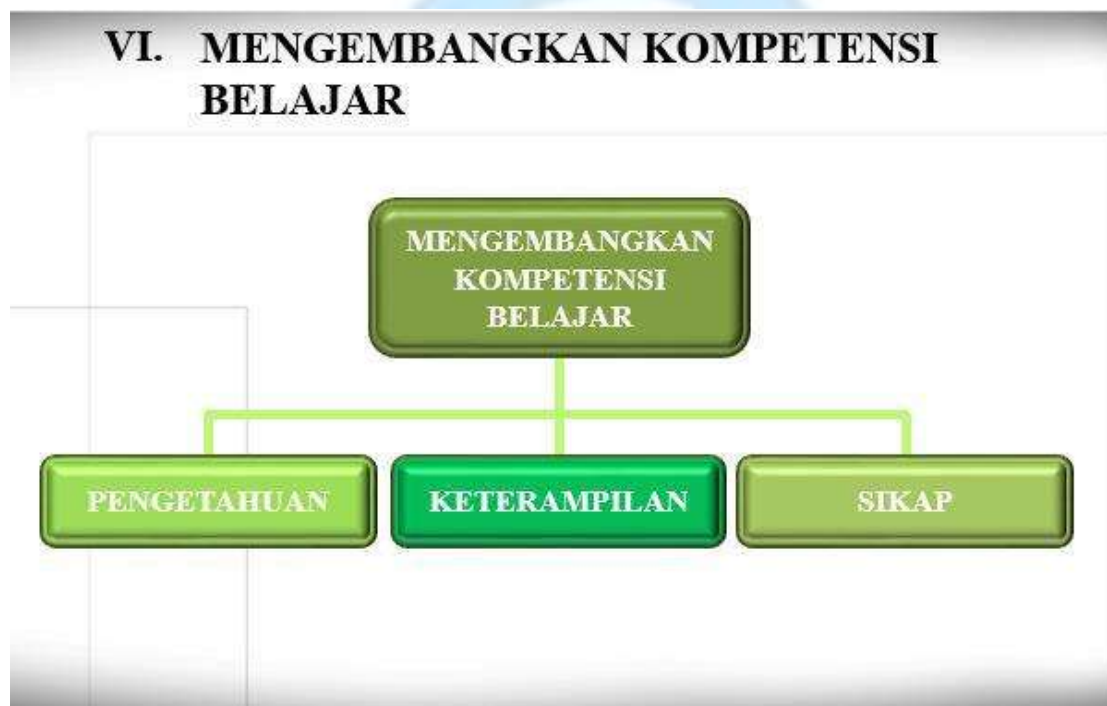
Gambar 7. Mengembangkan Motivasi Belajar