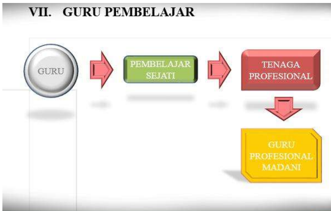
Gambar 7. Guru Pembelajar

Guru Pembelajar adalah guru yang terus belajar untuk terus mengembangkan keahlian dirinya. Guru terus belajar untuk mengembangkan diri nya bukan untuk pemerintah ataupun kepala sekolah, tapi pada dasarnya seorang guru pendidik adalah pembelajar. Guru pembelajar adalah guru yang terus belajar disaat dirinya mengabdikan sebagai sorang pendidik. Hanya dari guru yang terus belajar dan berkarya, akan munculnya generasi penerus bangsa belajar yang dapat terus berkontribusi untuk masyarakat dan lingkungannya. Oleh karena itu jika seorang guru berhenti sebagai pembelajar maka guru tersebut berhenti pula sebagai seorang pendidik.