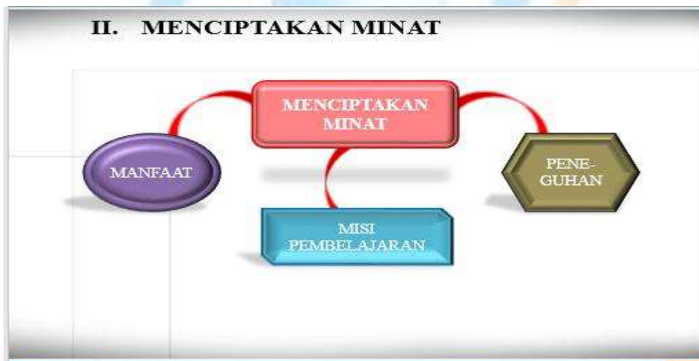
Gambar . Menciptakan Minat

Dalam pembelajaran, menciptakan minat belajar peserta didik merupakan salah satu faktor keberhasilan belajar. (Melinda & Susanto, 2018) Salah satu permasalahan dalam belajar yang terjadi pada peserta didik adalah rendahnya minat atau dorongan untuk belajar. Hal ini yang mengakibatkan terhambatnya aktivitas belajar peserta didik yang berdampak pada hasil belajar. Arti dari Minat itu sendiri adalah suatu perasaan yang timbul dari diri seseorang untuk mendorong seseorang melakukan sesuatu kegiatan. Minat belajar adalah suatu dorongan yang dimiliki oleh seseorang untuk melakukan kegiatan belajar. Minat dalam proses belajar mengajar merupakan salah satu faktor yang berpengaruh terhadap prestasi belajar peserta didik, jika minat peserta didik tinggi maka akan memperoleh prestasi