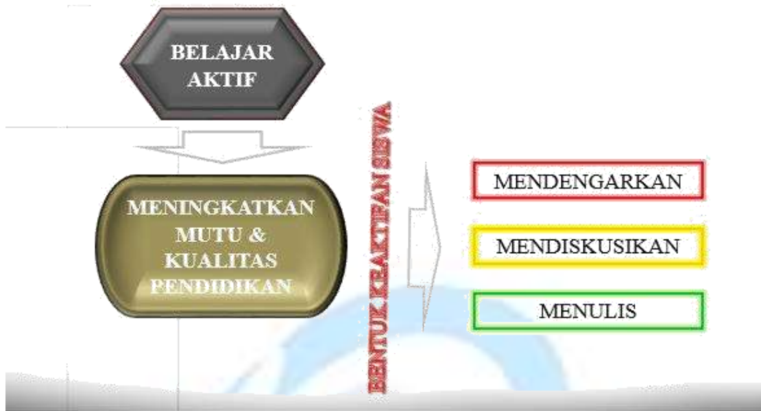
Gambar 4. Belajar Aktif

Belajar Aktif dapat meningkatkan mutu dan kualitas pendidikan. Peningkatan mutu pendidikan merupakan suatu hal yang semakin berkembang era globalisasi ini, sekolah sebagai lembaga pendidikan memiliki peran penting dalam peningkatan mutu pendidikan. Untuk meningkatkan mutu pendidikan siswa harus aktif dalam belajar. Bentuk-bentuk keaktifan siswa yaitu dengan mendengarkan, mendiskusikan dan menulis. Selain itu ada 6 hal lain yang dapat mempengaruhi keaktifan siswa dikelas yaitu; siswa, guru, materi, tempat, waktu dan fasilitas.