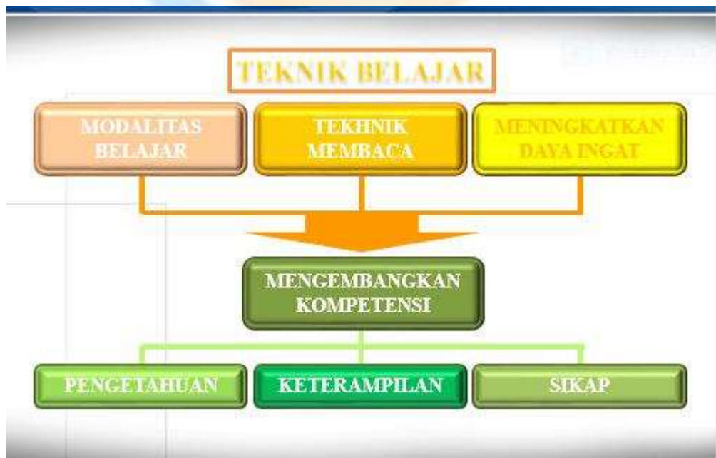
Gambar 1. Keterampilan Belajar

Keterampilan Belajar adalah suatu kemampuan yang harus dimiliki oleh seorang siswa untuk menguasai pembelajaran yang diajarkan agar siswa dapat sukses dalam mengikuti pembelajaran. Keterampilan belajar dapat diartikan juga sebagai seperangkat metode dan teknik yang baik dalam menguasai materi pembelajaran.