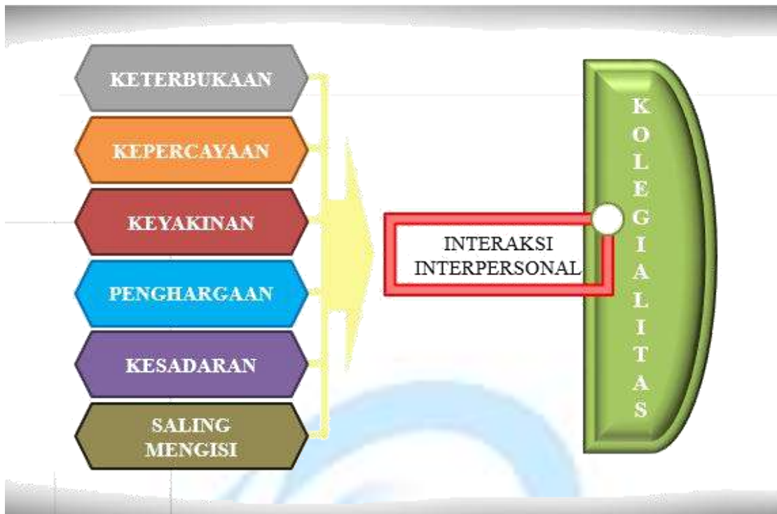
Gambar 14. Interaksi Interpersonal