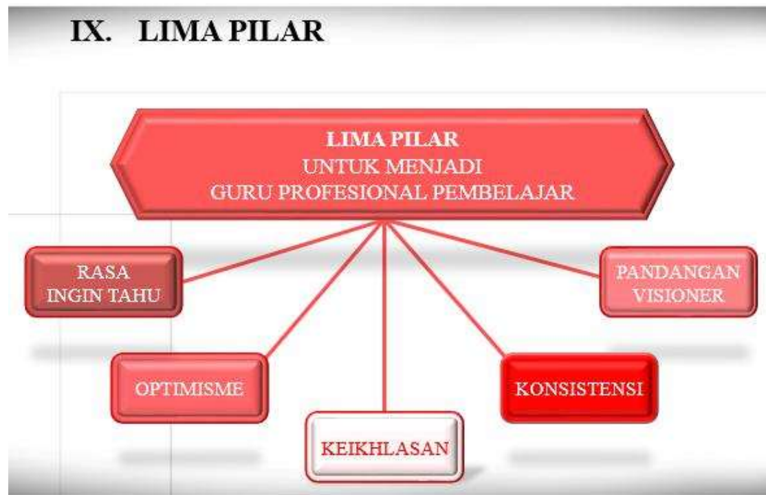
Gambar `10. Lima Pilar Guru profesional Pembelajar

guru dalam proses pembelajaran. Didalam kegiatan menutup pelajaran ini pun guru memberi kesimpulan tentang materi yang telah dibahas dan memberi pekerjaan rumah yang harus diselesaikan oleh peserta didik.