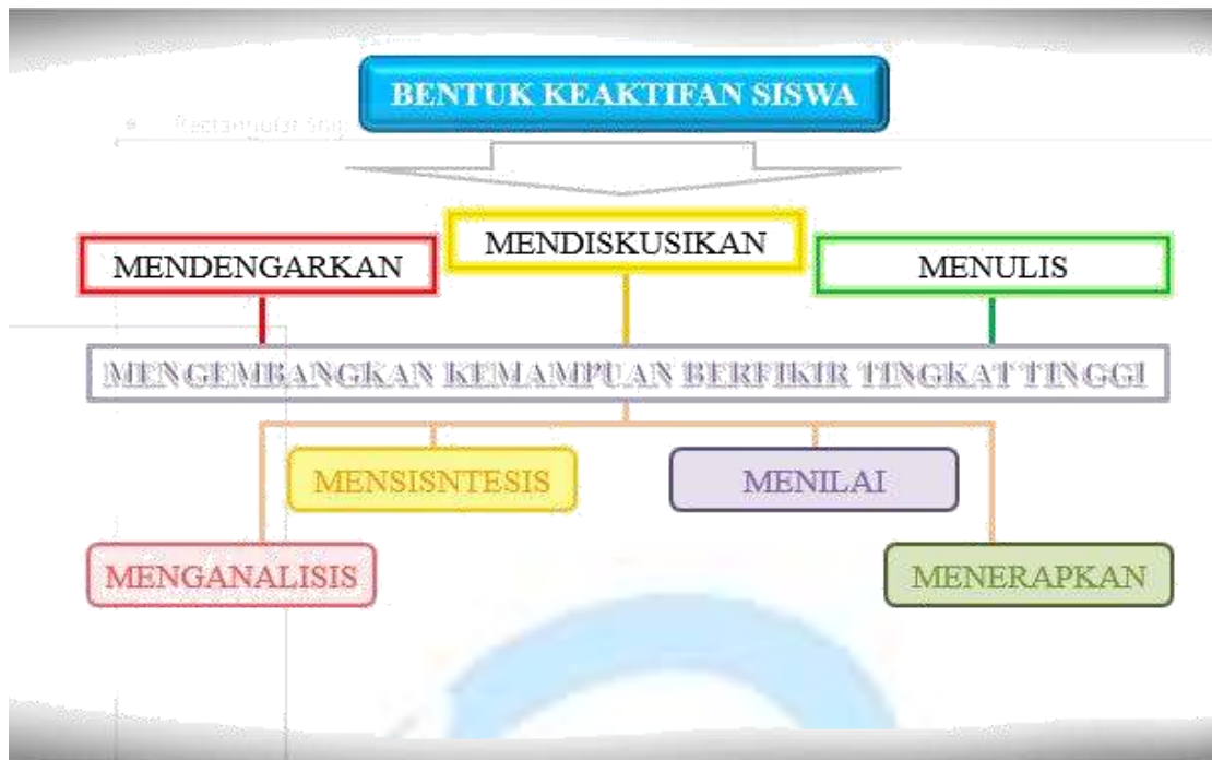
Gambar 5. Bentuk Keaktifan Siswa

Beberapa bentuk keaktifan siswa, antara lain: mendengarkan, mendiskusikan dan menulis. Hal tersebut bertujuan untuk emngembangkan kemampuan berpikir tingkat tinggi dalam bentuk mensintesis, menganalisis, menilai, menerapkan.