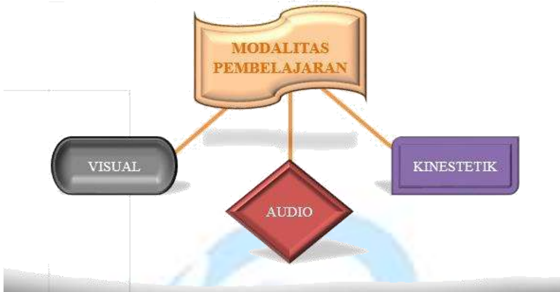
Gambar 6. Modalitas Belajar

Modalitas adalah cara berada atau berlangsungnya sesuatu. (Dewi & Susanto, 2018) Pembelajaran adalah suatu kegiatan yang dilakukan oleh guru dan peserta didik dalam proses belajar mengajar untuk mencapai suatu tujuan tertentu. Dapat ditarik kesimpulan bahwa Modalitas Pembelajaran adalah suatu cara atau gaya belajar siswa pada saat proses pembelajaran.