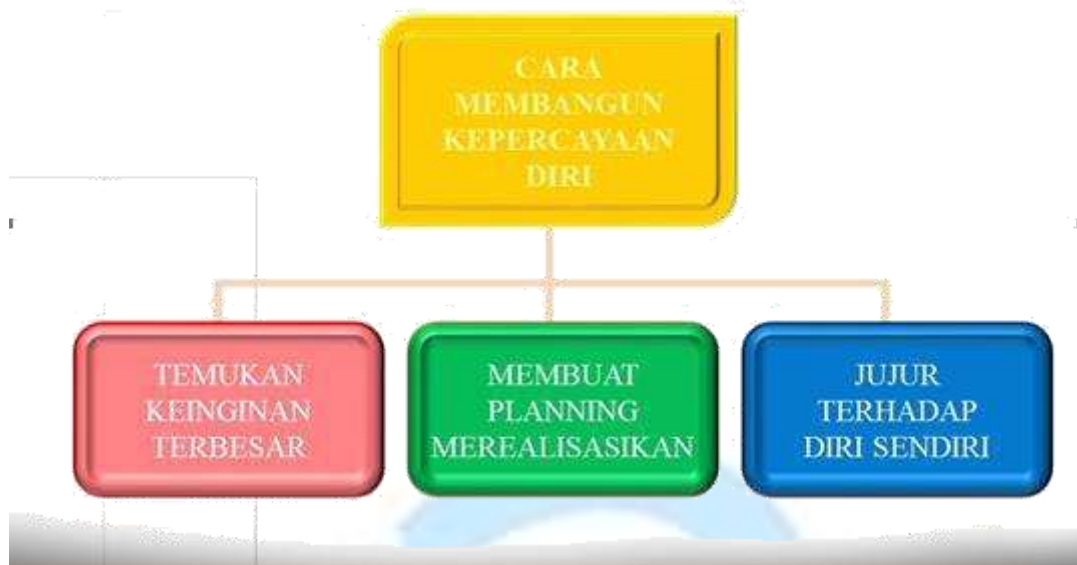
Gambar 3. Membangun Kepercayaan Diri