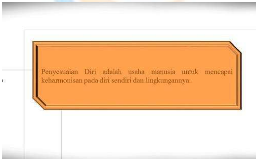
Gambar 6. Tujuan Penyesuaian Diri

Pada akhirnya penyesuaian diri adalah upaya manusia untuk mencapai keharmonisan pada diri sendiri dan lingkungannya