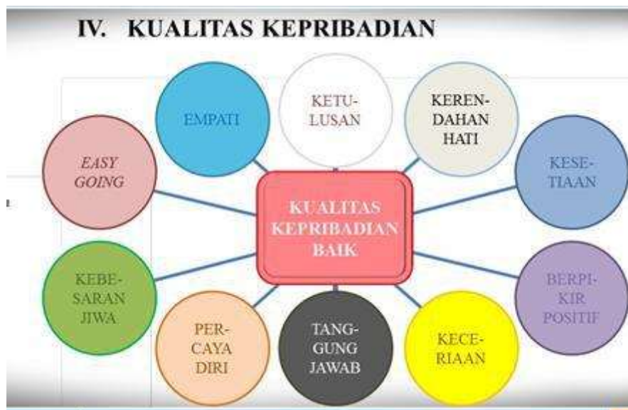
Gambar 7. Kualitas Kepribadian

Kualitas kepribadian seseorang dapat dikembangkan melalui upaya-upaya sebagai berikut: