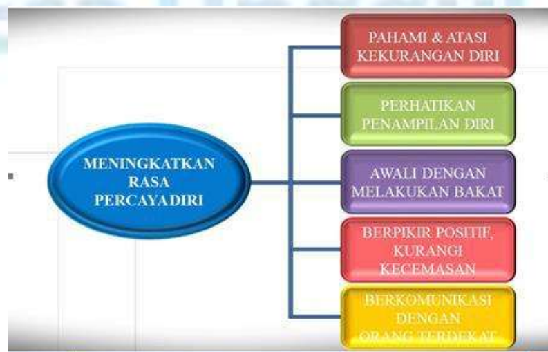
Gambar 4. Meningkatkan Rasa Percaya Diri