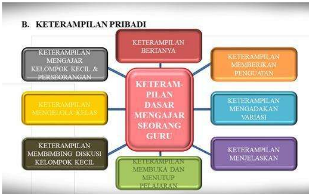
Gambar 2. Keterampilan Dasar Mengajar sebagai Keterampilan Pribadi Guru

Keterampilan membuka dan menutup pembelajaran.