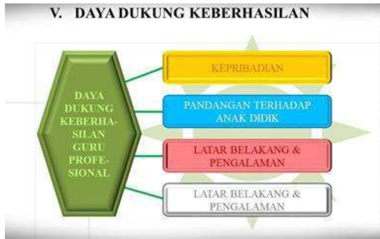
Gambar 8. Daya Dukung Keberhasilan