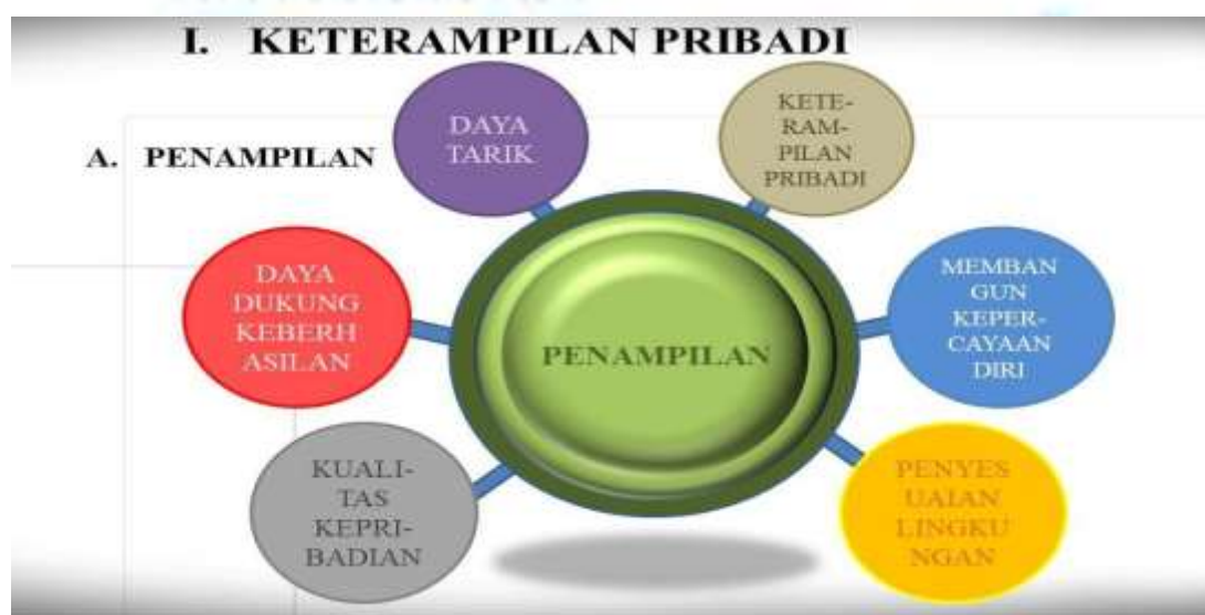
Gambar 1. Penampilan sebagai Keterampilan Pribadi