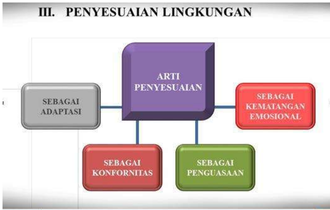
Gambar 5. Penyesuaian Lingkungan