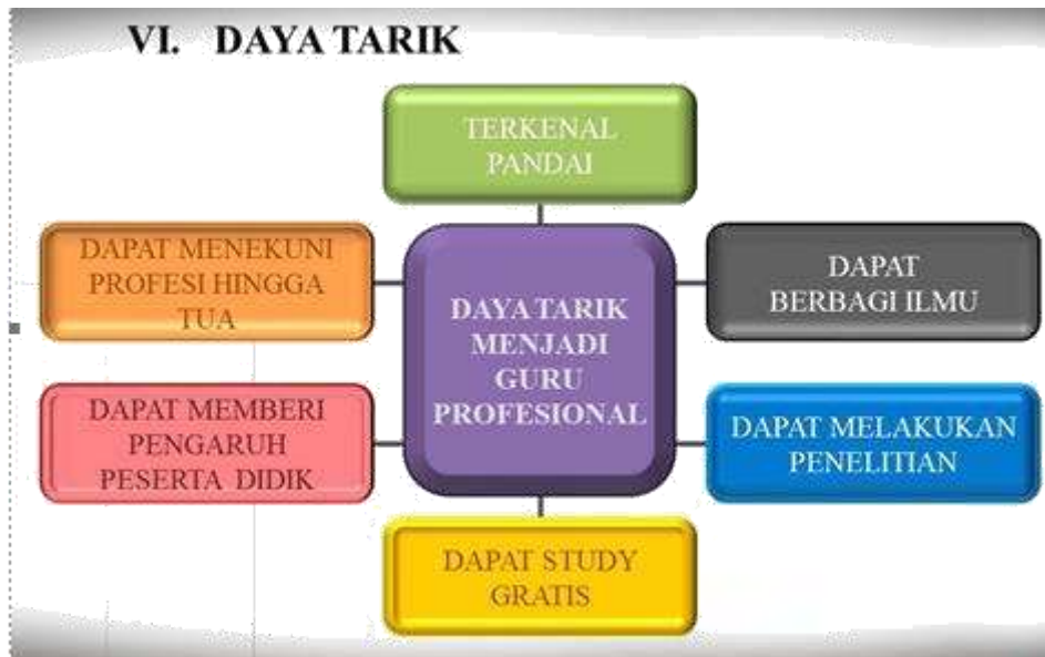
Gambar 9. Daya Tarik Guru