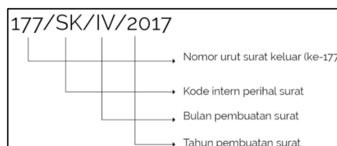
Gambar 2.6 Nomor Surat

Nomor surat berfungsi untuk memudahkan administrasi persuratan yaitu mengetahui jumlah surat yang keluar dan mengetahui unit asal surat. Penulisan kata nomor surat ditulis lengkap ( Nomor ) kemudian diikuti dengan tanda titik dua. Dalam penulisan nomor surat tidak diantarai dengan spasi.