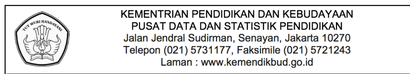
Gambar 2.2 Contoh Kop Surat

Kepala surat atau yang bisa juga disebut dengan kop surat merupakan bagian teratas dalam sebuah surat. Kop surat berfungsi untuk memberikan informasi mengenai nama, alamat dan juga bisa menjadi alat promosi dari suatu lembaga. Berikut bagian-bagian dari kop surat.