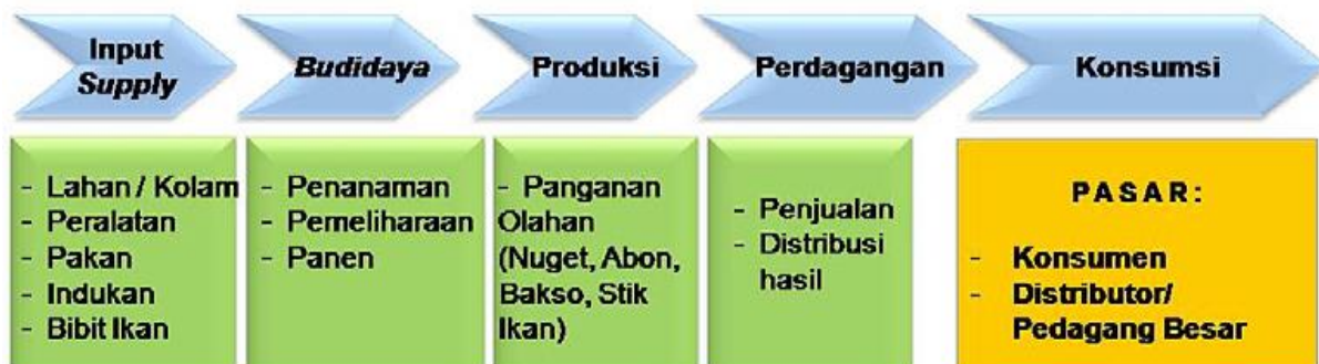
Gambar 4. Rantai Nilai Bisnis Budidaya Ikan Air Tawar

Rantai nilai bisnis budidaya perikanan air tawar ini memiliki keterkaitan dengan beberapa sektor lainnya, antara lain: