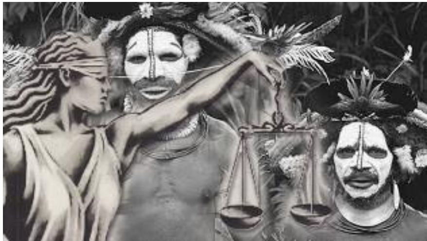
Ilustrasi delik adat

haruslah dilakukan secara menyeluruh dan sistematis dengan memperhatikan nilai-nilai yang berkembang dimasyarakat.