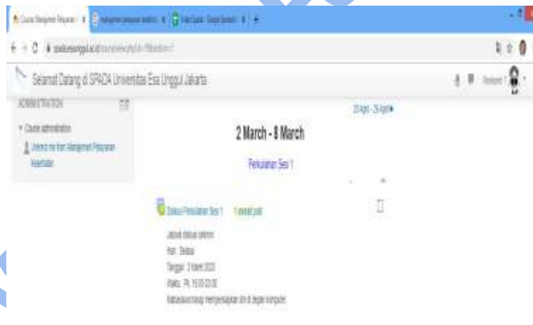
Gambar 9. Diskusi Sinkron

Mahasiswa dan dosen juga dapat menggunakan fitur diskusi untuk melaksanakan diskusi sinkron (chat). Perhatikan hari, tanggal dan jam chatting dan siapkan untuk berada di depan layar komputer atau HP sesuai jadwal diskusi yang telah ditetapkan oleh dosen.