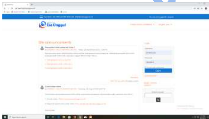
4. Gambar 1. Halaman Sebelum Login