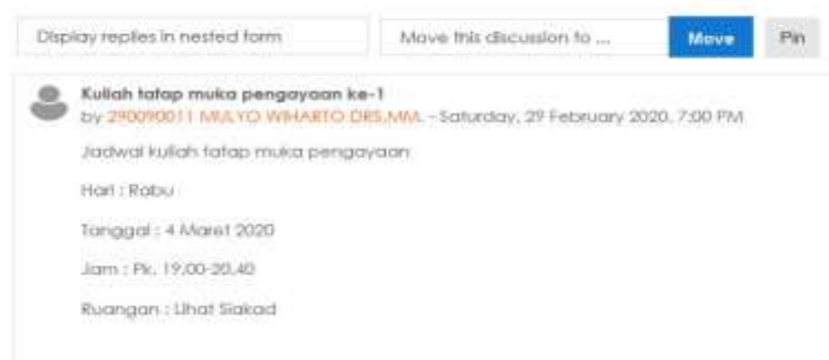
Gambar 6. Informasi Perkuliahan