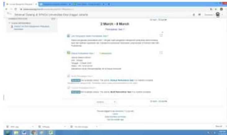
Gambar 10. Kuis dan Tugas

secara otomatis oleh LMS , segera setelah mahasiswa mengirimkan jawaban kuis ( submitted ). Tugas dinilai dan diberikan feed-back untuk perbaikan (jika ada) dan diselesaikan paling lambat hari Senin, jam 12.00 minggu berikutnya.