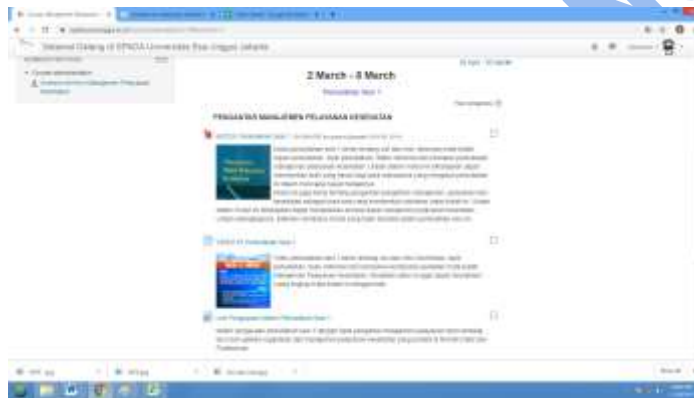
Gambar 7. Bahan Ajar Semester

Bahan ajar kuliah online terdiri dari modul, video dan materi pengayaan berupa e-journal atau e-book . Modul berupa file PDF dan link e-journal atau link e-book juga berupa file yang dapat didownload dan disimpan. Video berupa link video ke youtube channel dan bisa didownload filenya menggunakan https://id.savefrom.net