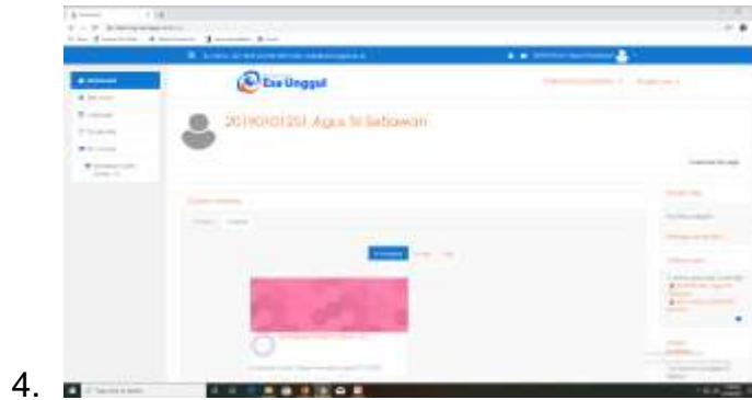
Gambar 2. Halaman Setelah Login