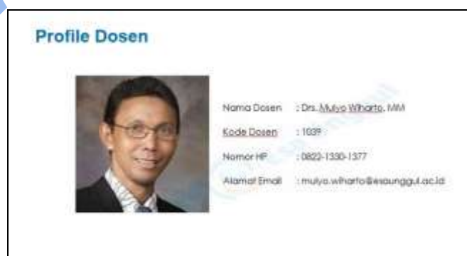
Gambar 3. Profil Dosen

Mahasiswa dapat melihat profil dosen dalam bentuk JPEG yang meliputi : Nama dosen, kode dosen, nomor HP dan alamat email.