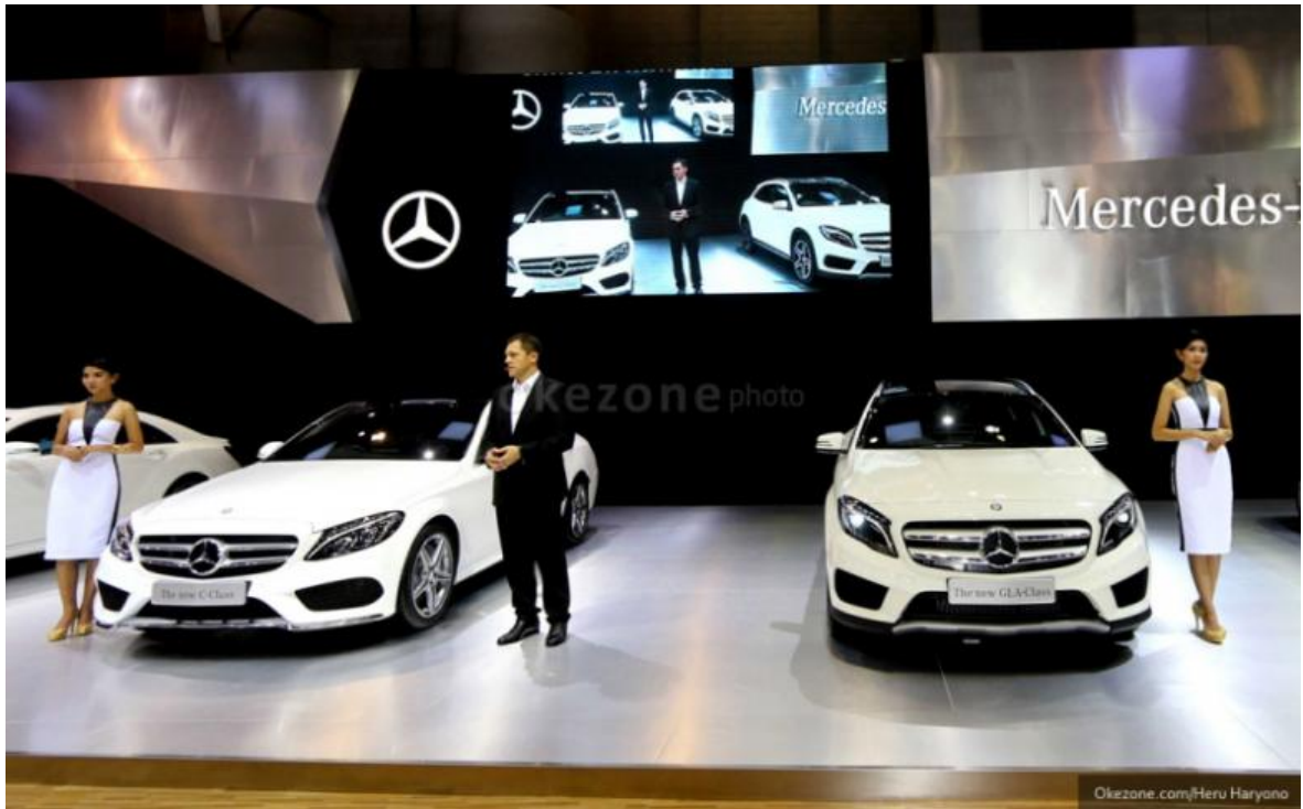
Sales Representatives dari Mercedes Benz mewakili brand Mercedes yang terkesan mewah, eksklusif, elegan, dan berkelas.