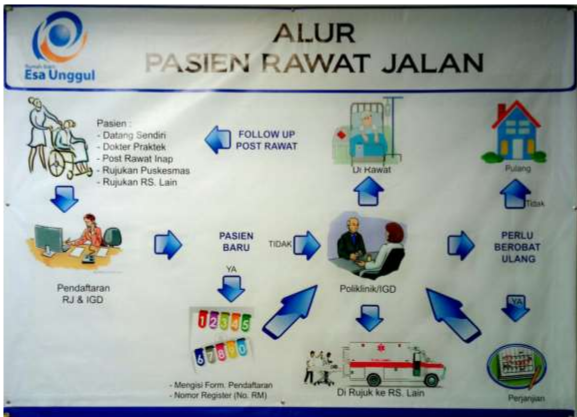
Gambar 7.1 Alur Pasien rawat jalan