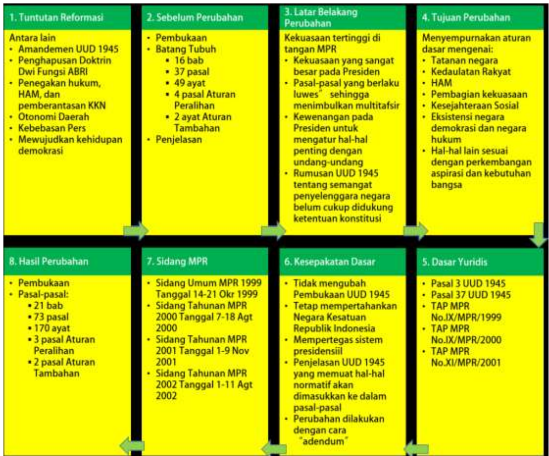
Skema gambar proses amendemen konstitusi UUD 1945

2. Konstitusi berfungsi untuk membatasi kekuasaan pemerintah sedemikian rupa, sehingga penyelenggaraan kekuasaan tidak bersifat sewenang-wenang. Dengan demikian, diharapkan hak-hak warganegara akan lebih terlindungi. Gagasan ini dinamakan konstitusionalisme, yang oleh Carl Joachim Friedrich dijelaskan sebagai gagasan bahwa pemerintah merupakan suatu kumpulan kegiatan yang diselenggarakan oleh dan atas nama rakyat, tetapi yang dikenakan beberapa pembatasan yang diharapkan akan menjamin bahwa kekuasaan yang diperlukan untuk pemerintahan itu tidak disalahgunakan oleh mereka yang mendapat tugas untuk memerintah (Thaib dan Hamidi, 1999).