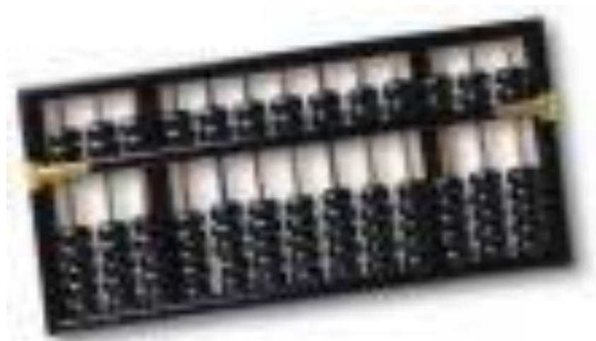
Gambar 2 Abacus

Abacus, yang muncul sekitar 5000 tahun yang lalu di Asia kecil dan masih digunakan di beberapa tempat hingga saat ini, dapat dianggap sebagai awal mula mesin komputasi.