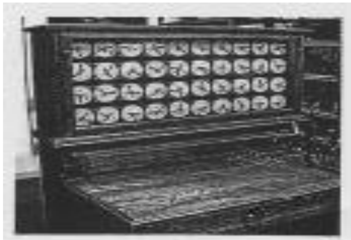
Gambar 3 kartu perforasi

Pada 1889, Herman Hollerith (1860-1929) juga menerapkan prinsip kartu perforasi untuk melakukan penghitungan. Tugas pertamanya adalah menemukan cara yang lebih cepat untuk melakukan perhitungan bagi Biro Sensus Amerika Serikat. Sensus sebelumnya yang dilakukan di tahun 1880 membutuhkan waktu tujuh tahun untuk menyelesaikan perhitungan. Dengan berkembangnya populasi, Biro tersebut memperkirakan bahwa dibutuhkan waktu sepuluh tahun untuk menyelesaikan perhitungan sensus.