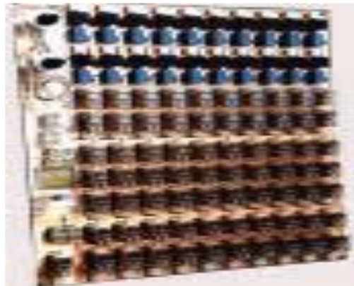
Gambar 4 Komputer generasi pertama

Dengan terjadinya Perang Dunia Kedua, negara-negara yang terlibat dalam perang tersebut berusaha mengembangkan komputer untuk mengeksploit potensi strategis yang dimiliki komputer. Hal ini meningkatkan pendanaan pengembangan komputer serta mempercepat kemajuan teknik komputer. Pada tahun 1941, Konrad Zuse, seorang insinyur Jerman membangun sebuah komputer, Z3, untuk mendesain pesawat terbang dan peluru kendali