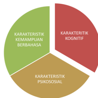
Gambar 1. Karakteristik Orang Dewasa sebagai pembelajar