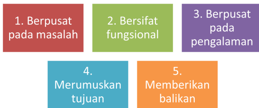
Gambar 1. Prinsip-Prinsip Pembelajaran orang Dewasa

Prinsip implementasi pembelajaran orang dewasa mencakup hal-hal sebagai berikut: